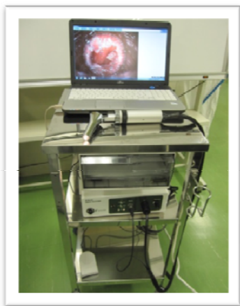
図1. デジタルアノスコープ